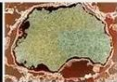
вирус папилломы человека (ВПЧ)