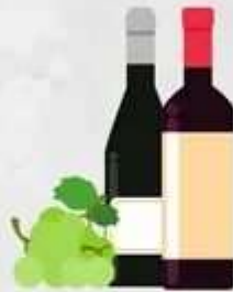
Вино (белое и красное)

350-400 мл для мужчин 300-350 мл для женщин